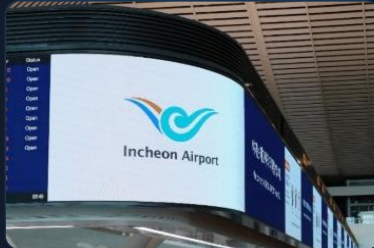
초대형 광고 사이니지 (AirHub Digital Signage)