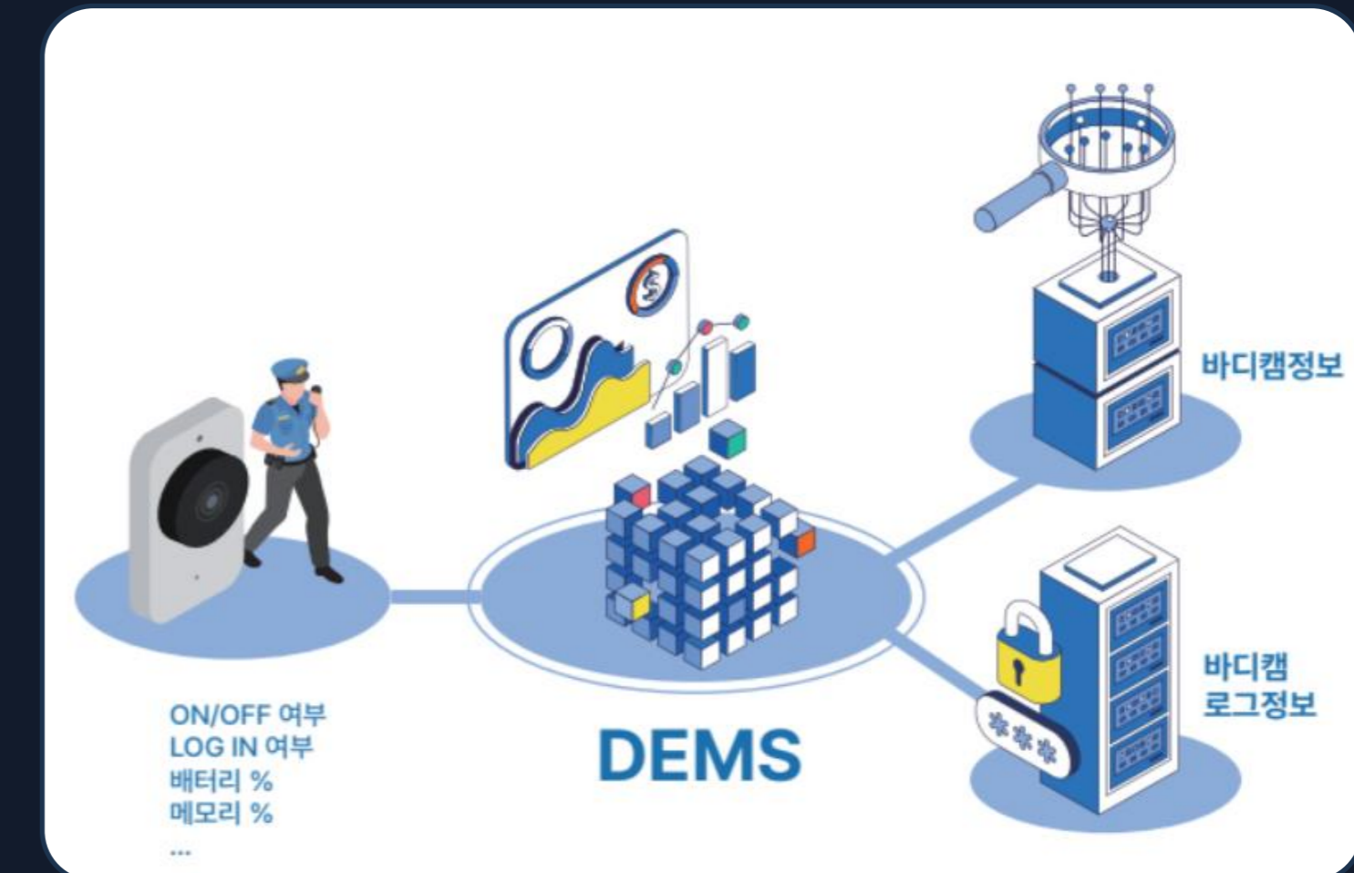
영상 증거관리 시스템 (AirDEMS)