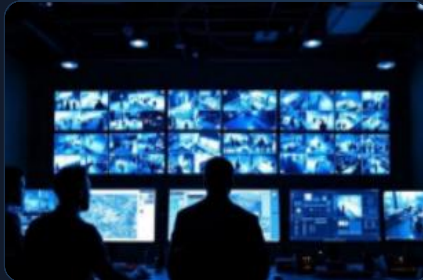
멀티스크린 시스템 (AirHub)